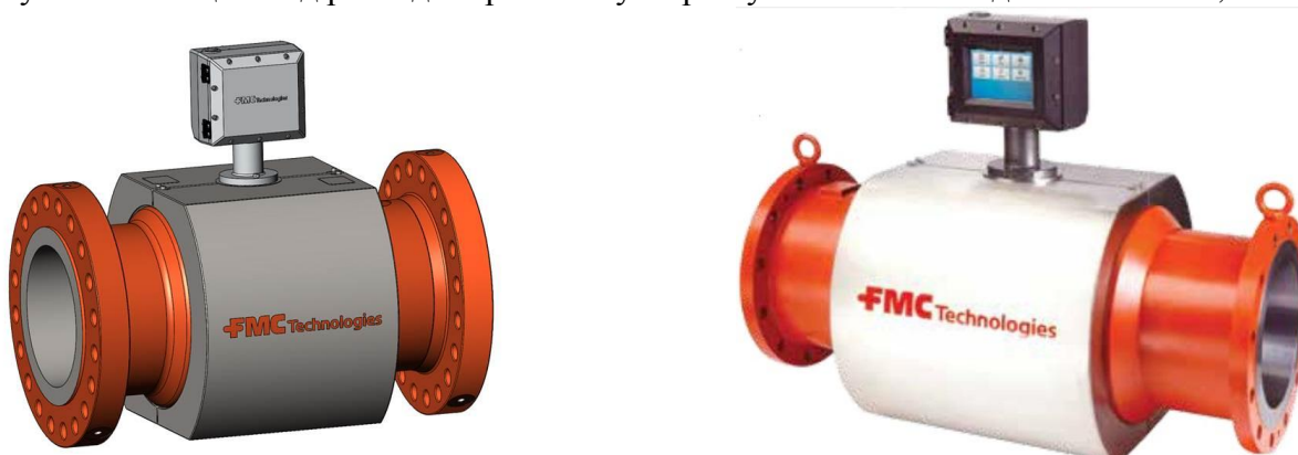
Рисунок 2 - Общий вид расходомеров газа ультразвуковых MPU моделей MPU800C, MPU1600C