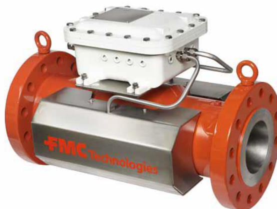
Рисунок 1 - Общий вид расходомеров газа ультразвуковых MPU моделей MPU800, MPU1200

Пломбирование осуществляют с помощью проволоки и свинцовой (пластмассовой) пломбы с нанесением знака поверки давлением на пломбы. Схема пломбировки от несанкционированного доступа расходомеров газа ультразвуковых MPU моделей MPU800, MPU1200 представлена на рисунке 3. Схема пломбировки от несанкционированного доступа расходомеров газа ультразвуковых MPU моделей MPU800C, MPU1600C представлена на рисунке 4.